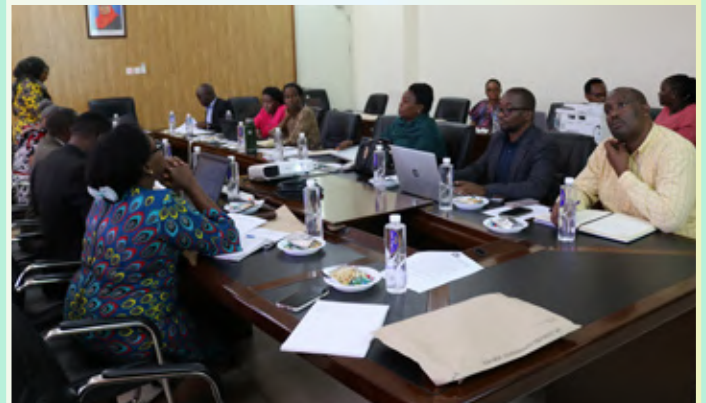
Wajumbe wa Kikao cha Menejimenti cha TSC wakiwa kwenye kikao cha kupitia Rasimu ya Ufafanuzi wa Kanuni za Maadili na Utendaji Kazi katika Utumishi wa Walimu. Kikao hicho kilifanyika mapema mwezi Januari, 2023 jijini Dodoma.