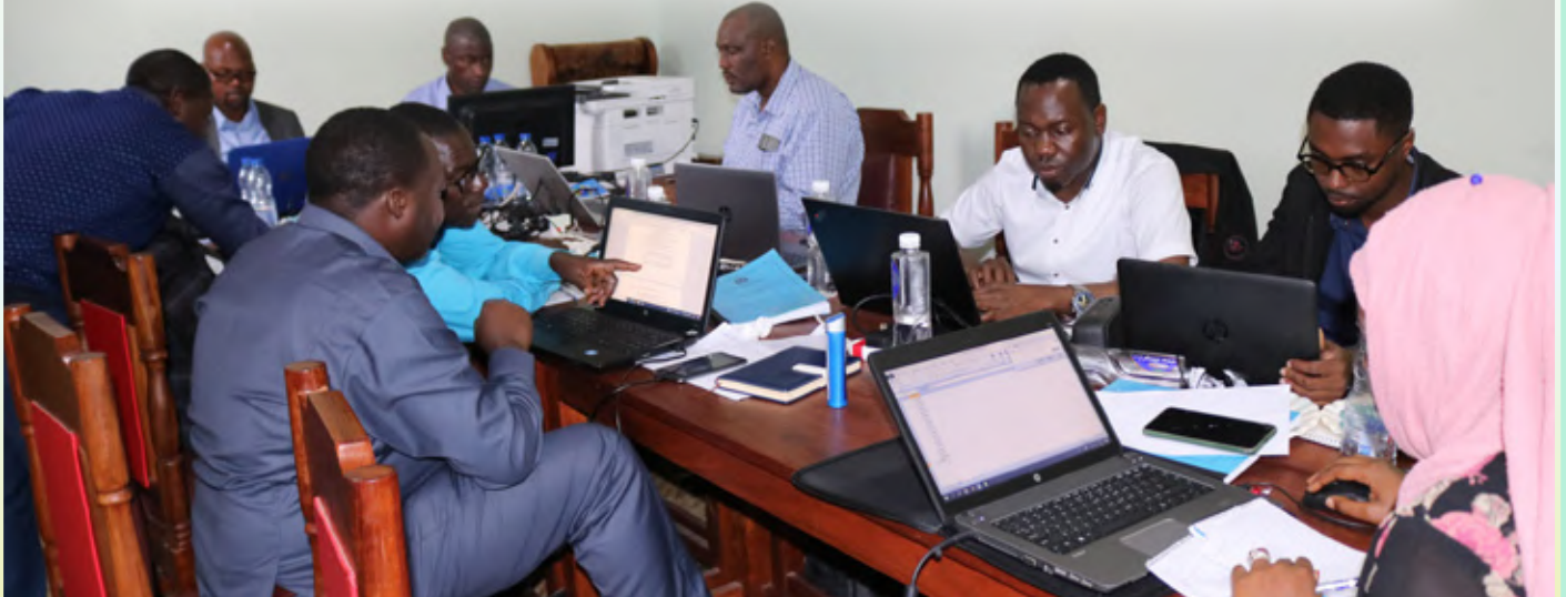
Maafisa Bajeti wa TSC, wakiwa katika kikao cha kuandaa Maoteo Bajeti ya TSC kwa mwaka 2023/2024 kilichofanyika mjini Singida hivi karibuni.