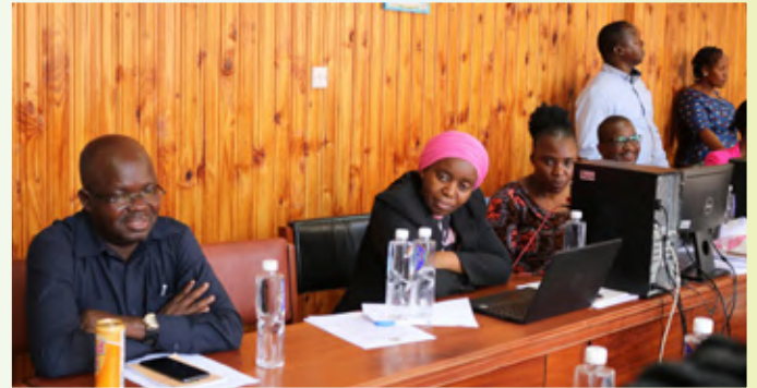
Watumishi wa TSC wakizwa katika hafla fupi ya kuukaribisha mwaka 2023 iliyofanyika TSC Makao Makuu Dodoma mapema mwezi Januari, 2023.