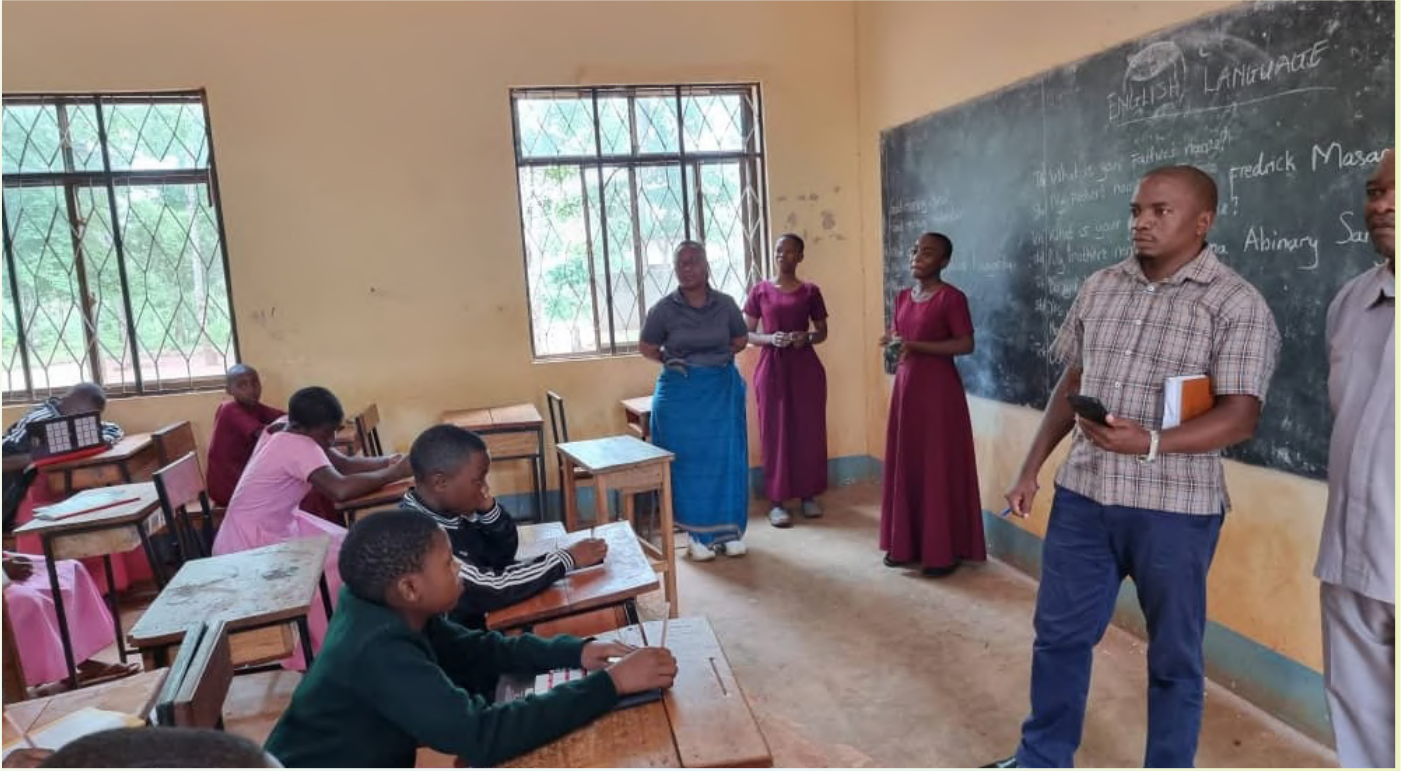
Katibu wa TSC, Mwl. Paulina Nkwama (wa kwanza kushoto kwa waliosimama) akiwa pamoja na walimu na wanafunzi wa Shule ya Wasichana Songea (Songea Girls) darasani.