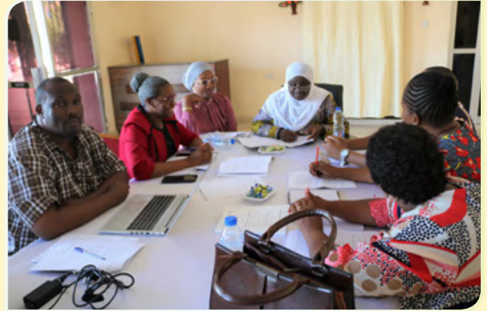
Washiriki wa Kikao Kazi cha kufanya mapitio ya Ufafanuzi wa Kanuni za Maadili na Utendaji Kazi katika Utumishi wa Walimu kilichofanyika mjini Morogoro Januari 10 -13, 2023 wakizwa katika vikundi kwa ajili ya kupitia rasimu ya ufafanuzi huo na kuiboresha.