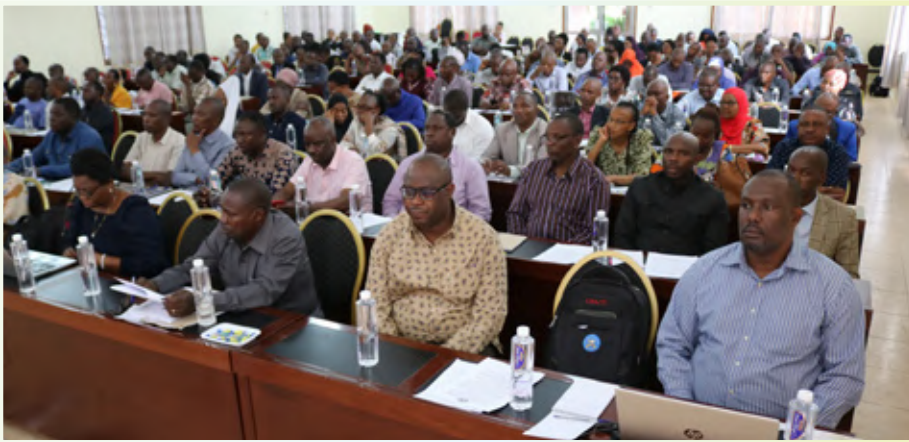
Mikutano ya kufanya Maboresho ya Elimu inayofadhiliwa na Benki ya Dunia kupitia Mradi wa BOOST ikiwa inaendelea.