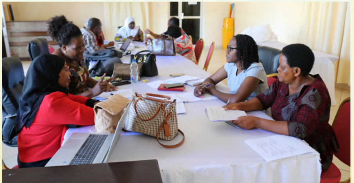
Washiriki wa Kikao Kazi cha kufanya mapitio ya Ufafanuzi wa Kanuni za Maadili na Utendaji Kazi katika Utumishi wa Walimu kilichofanyika mjini Morogoro Januari 10 -13, 2023 wakizwa katika vikundi kwa ajili ya kupitia rasimu ya ufafanuzi huo na kuiboresha.