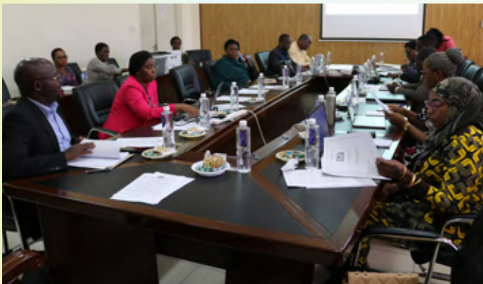
Wajumbe wa Kikao cha Menejimenti cha TSC wakiwa kwenye kikao cha kupitia Rasimu ya Ufafanuzi wa Kanuni za Maadili na Utendaji Kazi katika Utumishi wa Walimu. Kikao hicho kilifanyika mapema mwezi Januari, 2023 jijini Dodoma.