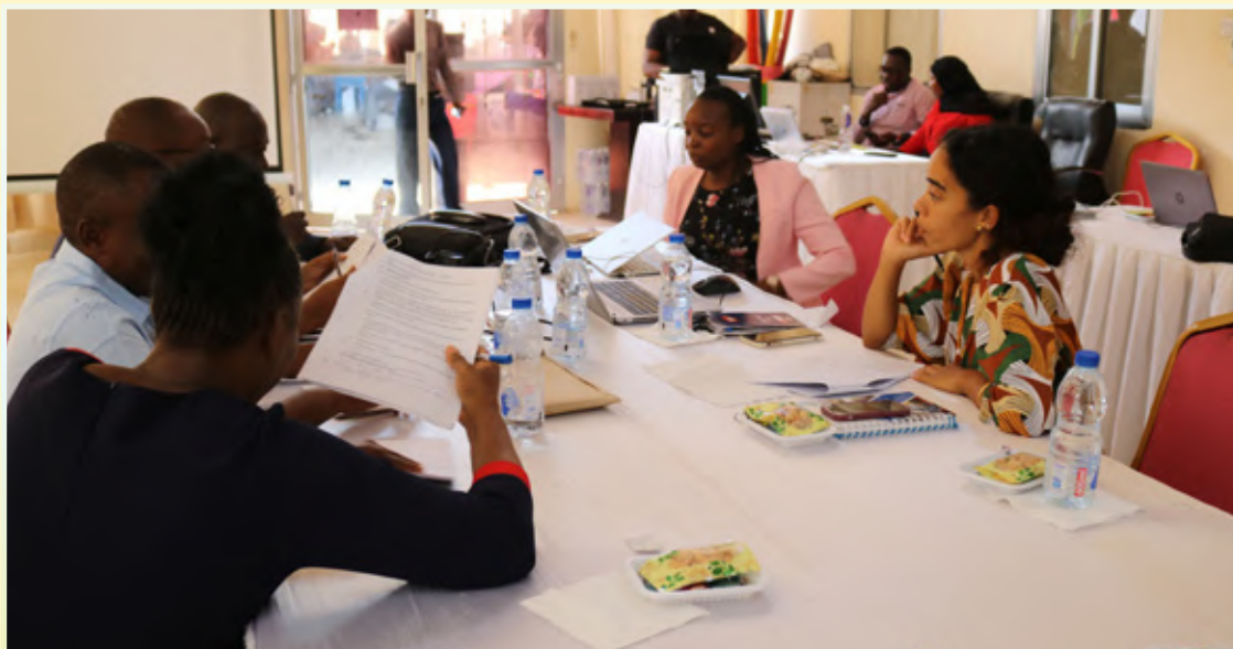
Washiriki wa Kikao Kazi cha kufanya mapitio ya Ufafanuzi wa Kanuni za Maadili na Utendaji Kazi katika Utumishi wa Walimu kilichofanyika mjini Morogoro Januari 10 -13, 2023 wakizwa katika vikundi kwa ajili ya kupitia rasimu ya ufafanuzi huo na kuiboresha.