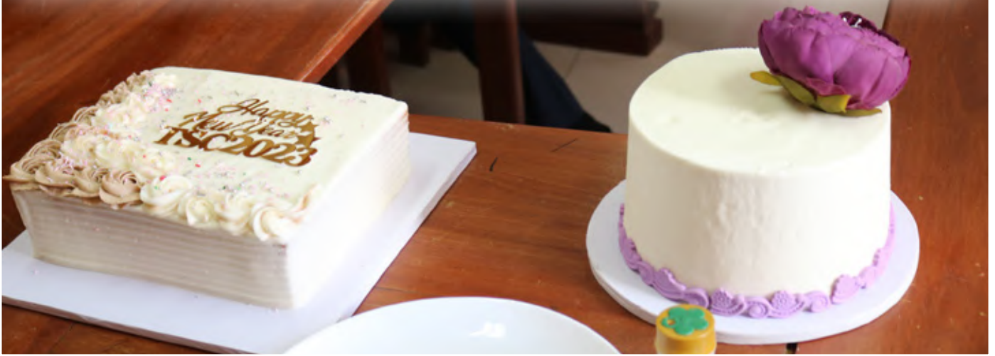
Keki iliyoandaliwa na Watumishi wa TSC kwa ajili ya kuukaribisha mwaka 2023.