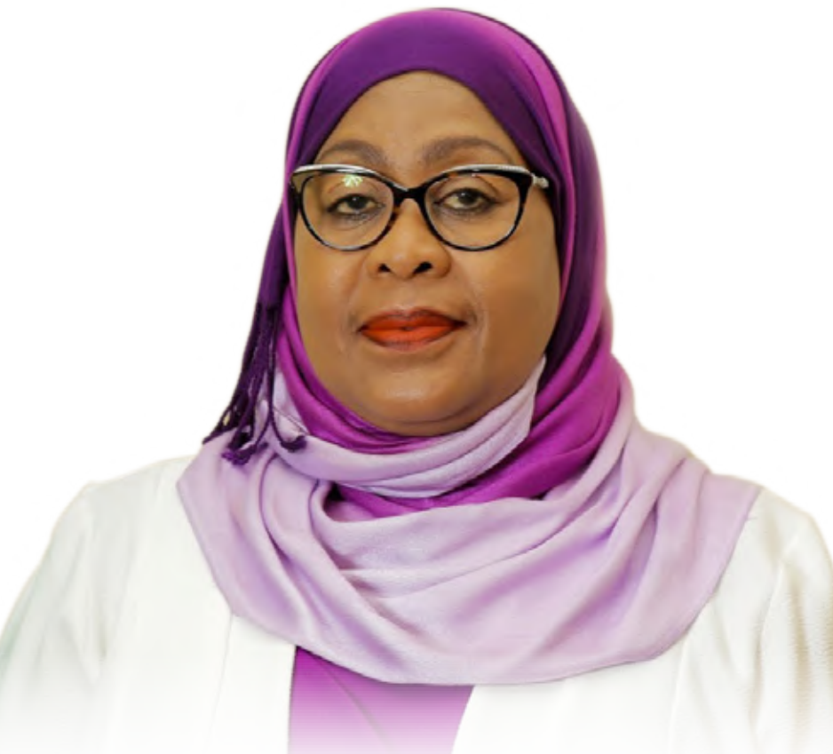
Mhe. Dkt. Samia Suluhu Hassan, Rais wa Jamhuri ya Muungano wa Tanzania.

"Baadhi ya shule zitavunjwa na kujengwa upya, nyingine zitafanyiwa ukarabati mkubwa pamoja na mdogo kwa lengo la kuzifanya ziwe na mazingira bora