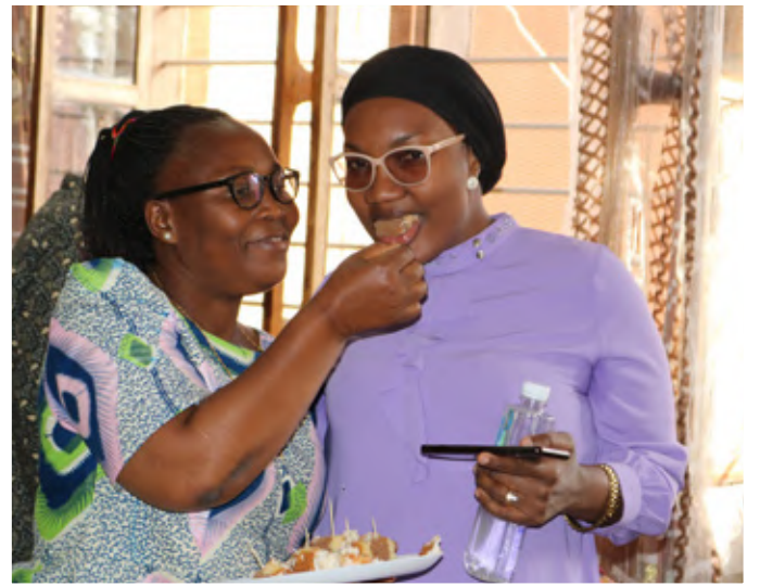
Katibu wa TSC akiwalisha keki watumishi mbalimbali wa TSC.